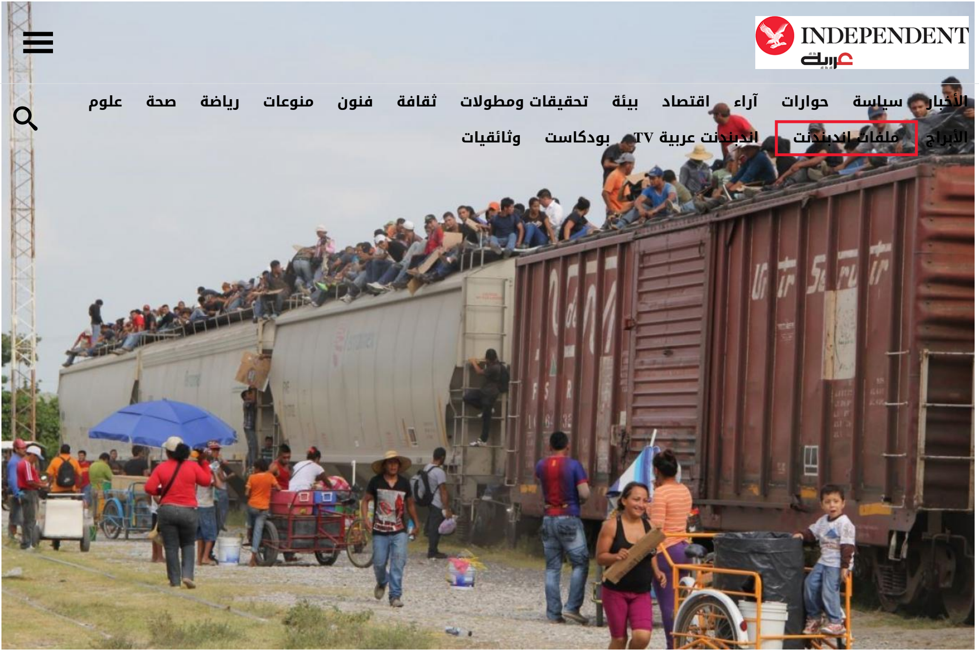
مهاجرون على حدود الولايات المتحدة