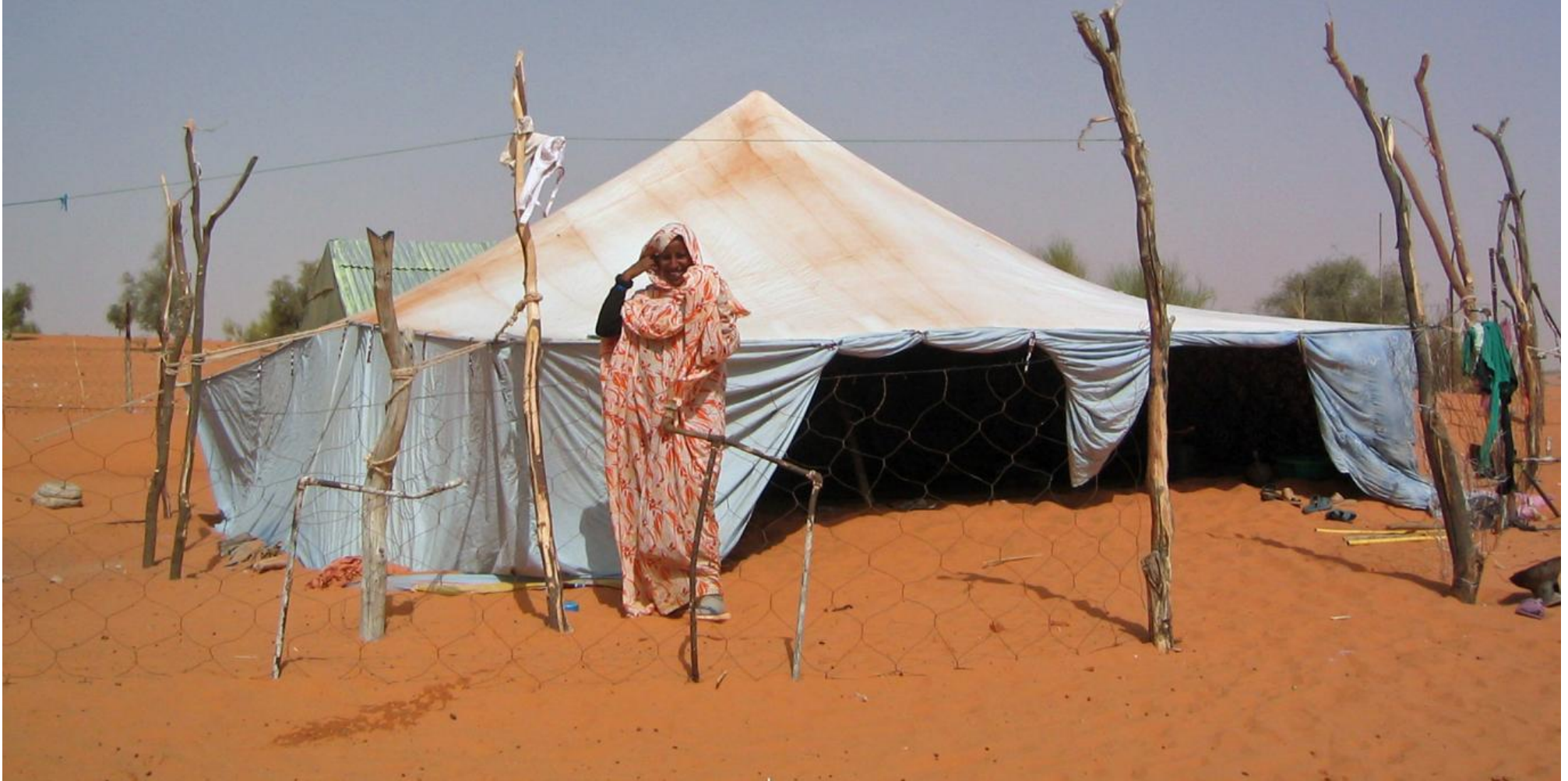
إمرأة بدوية أمام الخيمة (ويكبيديا)