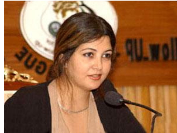
الكاتبة المصرية ميرال الطحاوي

كاتبة على موعد مع الجوائز؛ فقد اختيرت "الخباء" كأفضل رواية مصرية 1996، ثم حصلت الكاتبة على الجائزة التشجيعية عام 2000 عن روايتها "البانجنات الزرقاء"، بينما فازت "نقرات الظباء" بجائزة معرض القاهرة للكتاب، وأخيرا حصلت "بروكلين هايتس" على جائزة نجيب محفوظ للرواية، وهي المرشحة ضمن القائمة القصيرة لجائزة "البوكر" العربية.